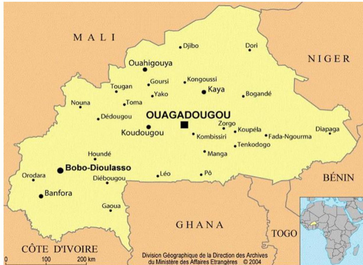
Carte du Burkina Faso